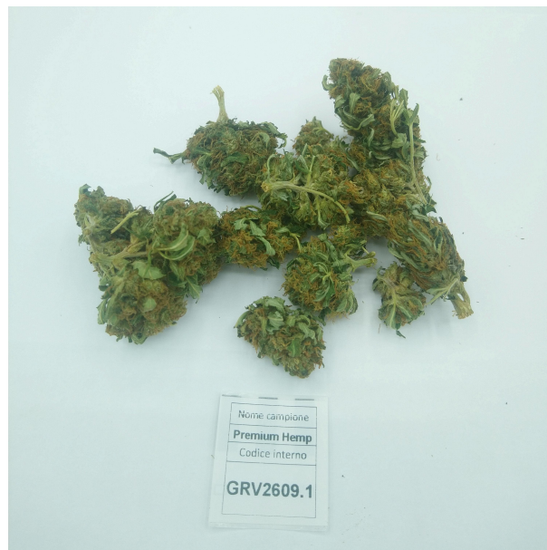
CAMPIONE ANALIZZATO: NA(10.00gr)